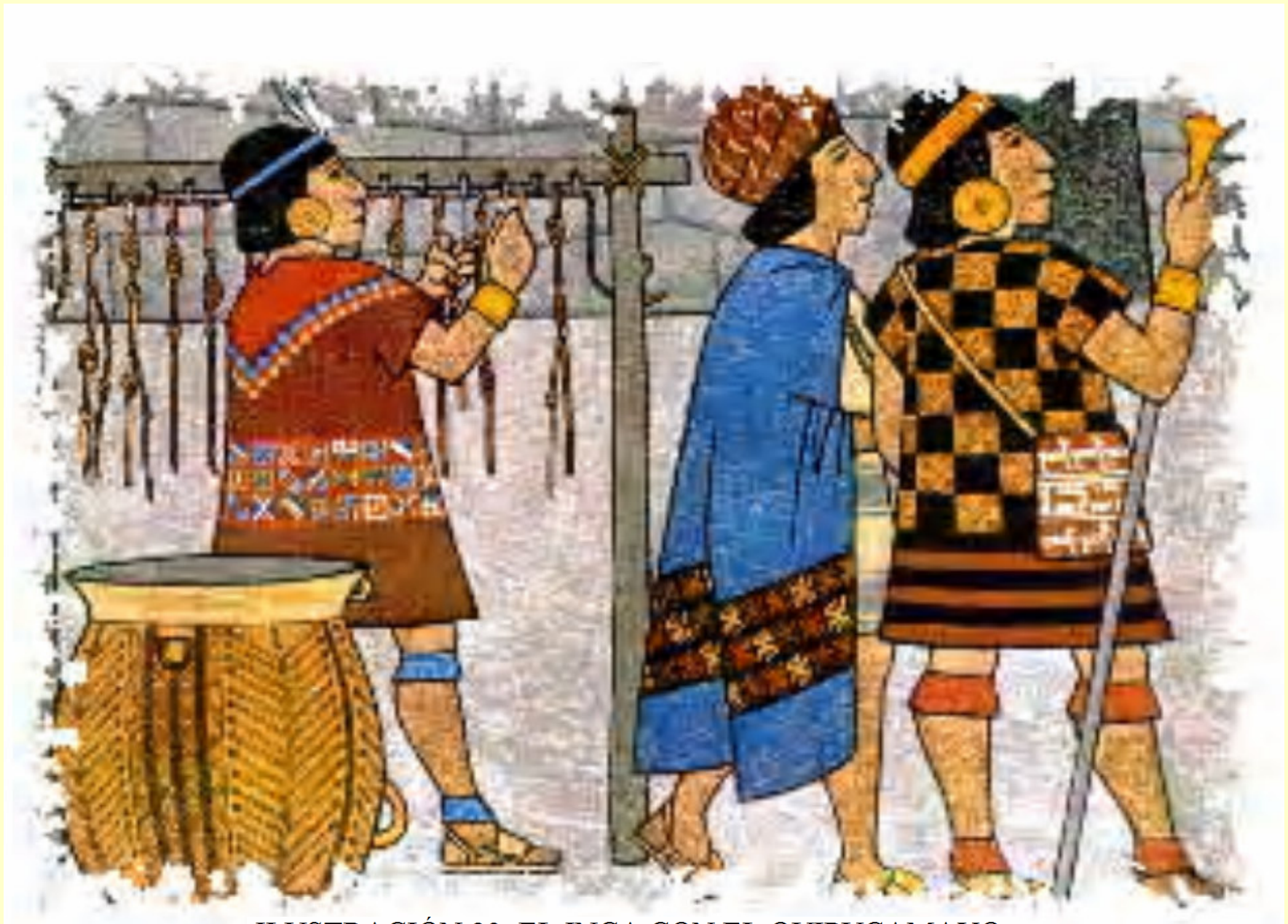
ILUSTRACIÓN 23. EL INCA CON EL QUIPUCAMAYO AL LADO, Y EL OFICIAL A CARGO DEL MANEJO DEL QUIPUS