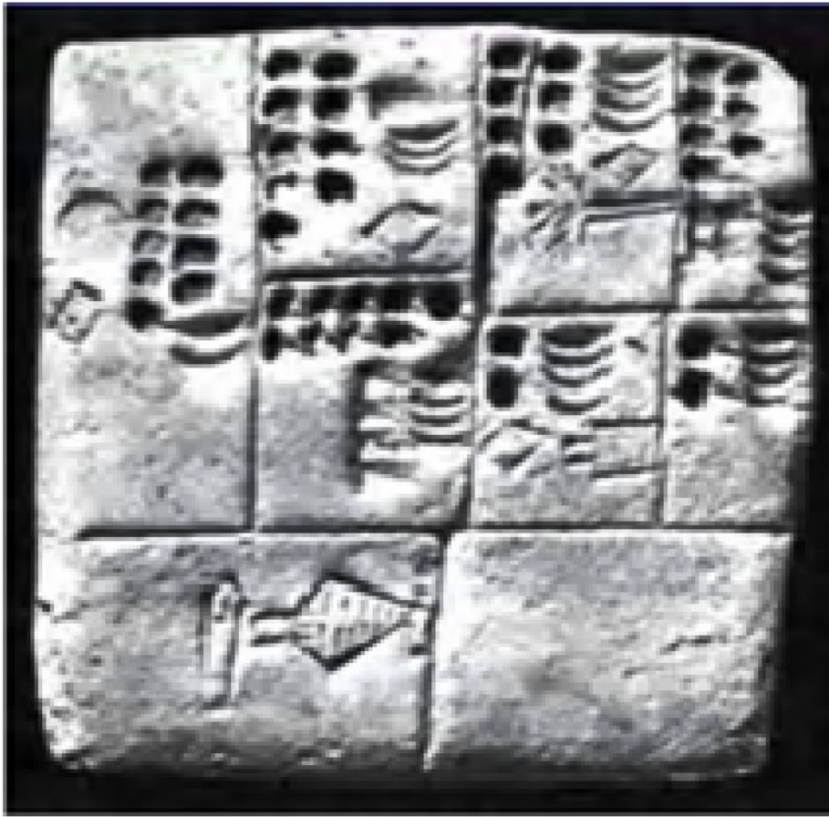
ILUSTRACIÓN 27. TABLILLA DE HACIA EL AÑO 3.000 a.J. CON CUENTAS DE INGREDIENTES PARA FABRICAR CERVEZA