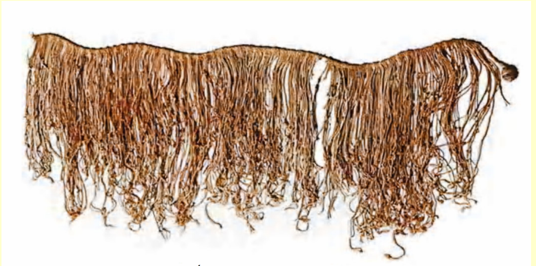
ILUSTRACIÓN 24. UN QUIPUS COMPLETO