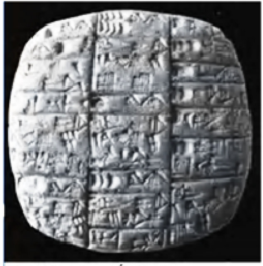
ILUSTRACIÓN 28. TABLILLA DE HACIA EL AÑO 2.600 a.J. CON CUENTAS DE LA PRODUCCIÓN DE PRODUCTOS LÁCTEOS