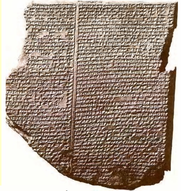
ILUSTRACIÓN 30. TABLILLA DE UNOS 2.600 AÑOS a.J. CON UN FRAGMENTO DE LA LEYENDA DE GILGAMESH