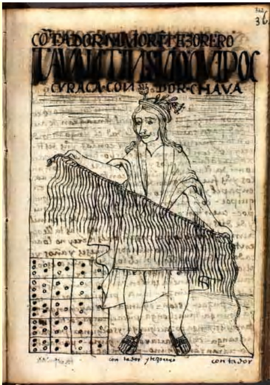
ILUSTRACIÓN 21 EL CONTADOR Y SU QUIPUS