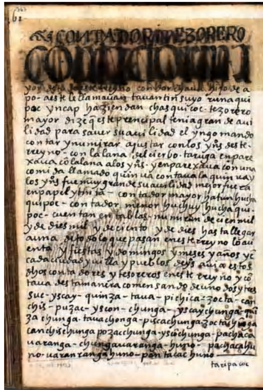
ILUSTRACIÓN 22 PÁG. 363