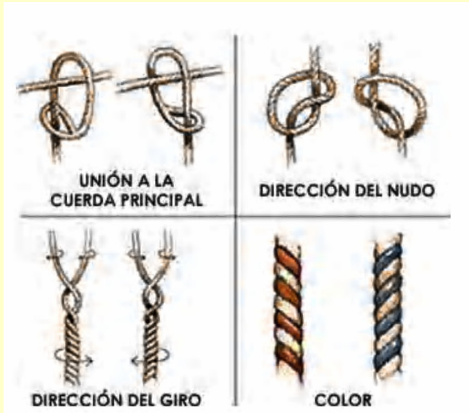
ILUSTRACIÓN 26. CLASES DE CUERDAS, NUDOS Y COLORES DE LOS QUIPUS