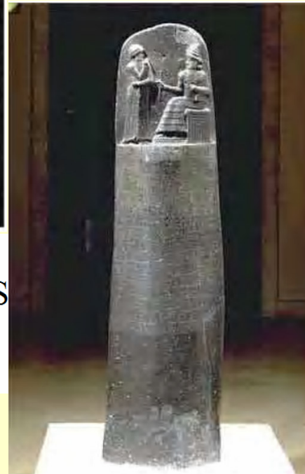
ILUSTRACIÓN 31. ESTELA DONDE ESTÁN GRABADAS LAS 282 LEYES DE CÓDIGO DE HAMMURABI AÑO 1760 a.J.