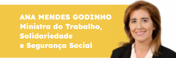
ANA MENDES GODINHO Ministra do Trabalho, Solidariedade e Segurança Social

Artista multi-facetado, autor e compositor de todas as músicas incluídas nos seus álbuns, começou a sua carreira como docente aos 16 anos na Escola de Música do Porto e tem nos óculos de sol a sua imagem de marca. O seu álbum de estreia, intitulado "Viagens", atingiu vendas recorde e marcou uma geração de portugueses