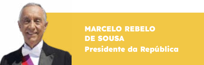
MARCELO REBELO DE SOUSA Presidente da República

Presidente do IFAC e ex-Administrador não executivo da Jerónimo Martins sendo atualmente presidente independente da Comissão de Controlo Interno da empresa. Tendo sido Chief Audit Executive do Grupo Unilever.