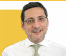
ANTÓNIO MENDONÇA MENDES Secretário de Estado dos Assuntos Fiscais

Secretário de Estado dos Assuntos Fiscais; Advogado; Licenciado em Direito pela Universidade de Coimbra; Secretário de Estado da Justiça do Governo de Portugal (1999-2002).