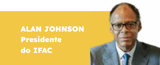
ALAN JOHNSON Presidente do IFAC

Deputado do Parlamento Europeu desde 2009, onde integra o Grupo do Partido Popular Europeu (PPE) e Presidente honorário da ACES Europe - Federação Europeia das Cidades e Capitais de Desporto. Autor de várias publicações como: "Sem Fronteiras — programas disponíveis para jovens"; "Fundos Europeus 2014-2020 Manual do Autarca"; "Pela Nossa Terra"