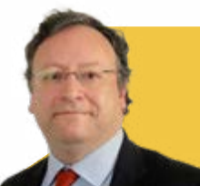
FRANCISCO ASSIS Presidente de Conselho Económico e Social

Presidente do Conselho Económico e Social pela Assembleia da República; Licenciado em Filosofia pela Faculdade de Letras da Universidade do Porto; foi Presidente da Câmara de Amarante; Deputado à Assembleia da República, presidente do grupo parlamentar Socialista e deputado Europeu