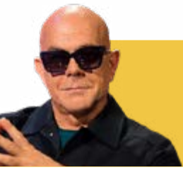
PEDRO ABRUNHOSA Músico e motivador

Artista multi-facetado, autor e compositor de todas as músicas incluídas nos seus álbuns, começou a sua carreira como docente aos 16 anos na Escola de Música do Porto e tem nos óculos de sol a sua imagem de marca. O seu álbum de estreia, intitulado "Viagens", atingiu vendas recorde e marcou uma geração de portugueses