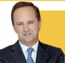
FERNANDO MEDINA Ministro das Finanças

Ministro das Finanças. Licenciado em economia e mestre em Sociologia Económica. Foi presidente da Câmara Municipal de Lisboa, vice-presidente com o pelouro das Finanças e presidente da Área Metropolitana de Lisboa. Foi deputado e vice-presidente do grupo parlamentar do PS.