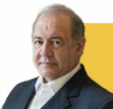
ANTÓNIO COSTA E SILVA Ministro da Economia e do Mar

Licenciado em engenharia de minas pelo Instituto Superior Técnico, mestre em engenharia de petróleos pelo Imperial College (Londres), e doutor em engenharia de reservatórios petrolíferos pelo Instituto Superior Técnico e pelo Imperial College. É ministro e preside a Comissão Nacional de Acompanhamento do PRR.